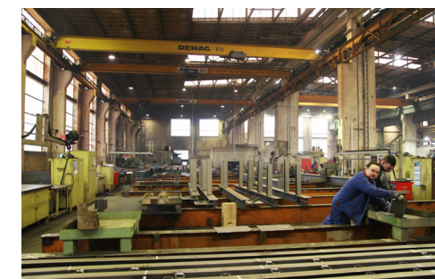
Blick in die Haupt-Montagehalle des Unternehmens