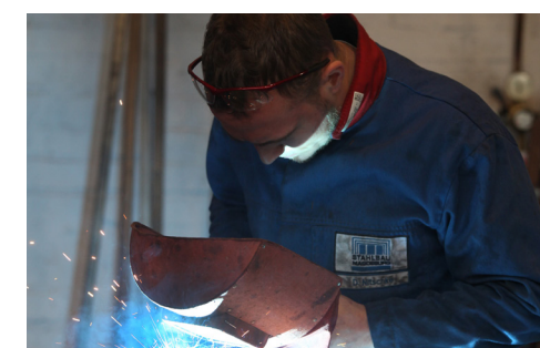
Schweißarbeiten an einem Geländer in der Lehrwerkstatt